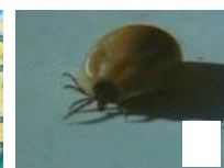
Uwaga na kleszcze. Jak się chr...