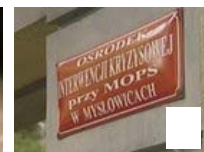
Niemowlę pobite przez pijanego...