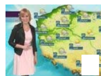
Pogoda na środę