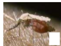
Skuteczna broń na komary